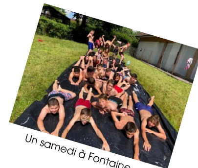
Un samedi à Fontaine...